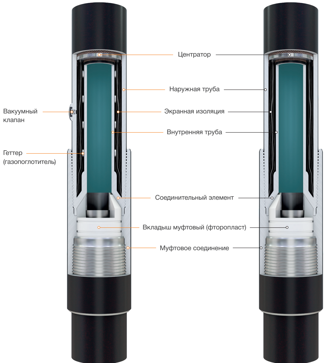
ТЛТ в безвакуумном исполнении